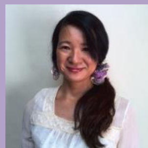
JHS 認定上級インストラクター 園芸療法リーダー ENCHANTE' (Herbal café)経営 www.enchante2015.com