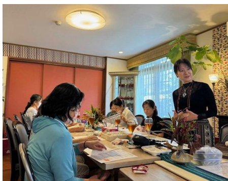
上：安田先生講座風景(沖縄) 左：アンシャンテ入口アーチ