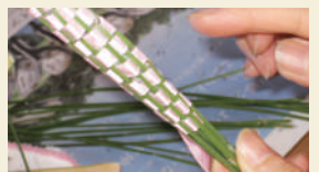
ラベンダーバンドルズ