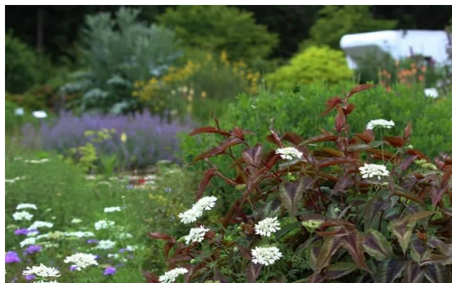
常盤植物化学研究所佐倉ハーブ園 西洋ノコギリソウ (ヤロウ)

申し込み・お問い合わせ：JHS 事務局までメール・FAXにてお名前・連絡先をご連絡下さい。