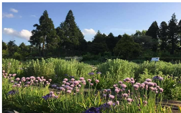
常盤植物化学研究所佐倉ハーブ園 チャイブ